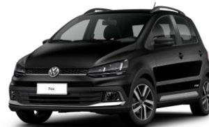
Negro Ninja (Sólido)

Comentarios: * La forma de medición es la siguiente: tanque de combustible lleno al 90%, fluidos en nivel, todos los accesorios del auto colocados (llanta de repuesto, reflejantes, porta placas, herramienta, manual de abordo, entre otros). Sin conductor u otro peso adicional. El equipamiento mencionado en el presente documento corresponden a la información disponible al momento de la impresión. Imágen solamente ilustrativa. El importador se reserva el derecho de realizar cambios sin previo aviso. El importador no será responsable de errores tipográficos. Antes de firmar un contrato, por favor solicite más información sobre el equipamiento de serie y equipos opcionales a su concesionario. La ficha técnica es válida desde el 01 de Junio de 2018. Todos los vehículos incluyen 2 años de garantía sin límite de kilometraje contada a partir de la fecha de entrega registrada en el manual de Mantenimiento y Garantía Volkswagen. La Línea de asistencia Volkswagen (ANDI Asistencia) es 18000919713 a nivel nacional y 6463222 para Bogotá.