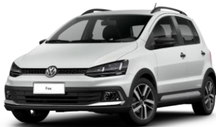
Blanco Cristal (Sólido)