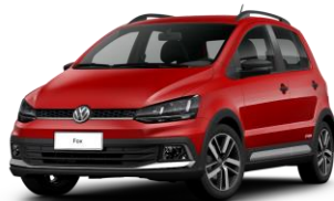
Rojo Tornado (Sólido)