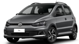
Gris Platino (Metálico)